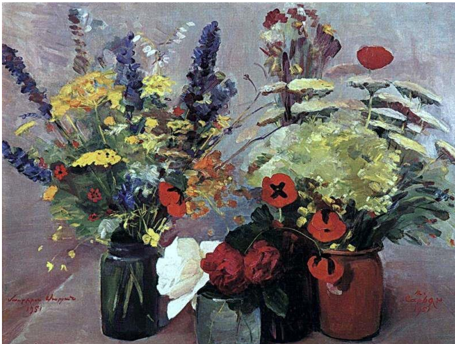
М.С. Сырян. Полевые цветы