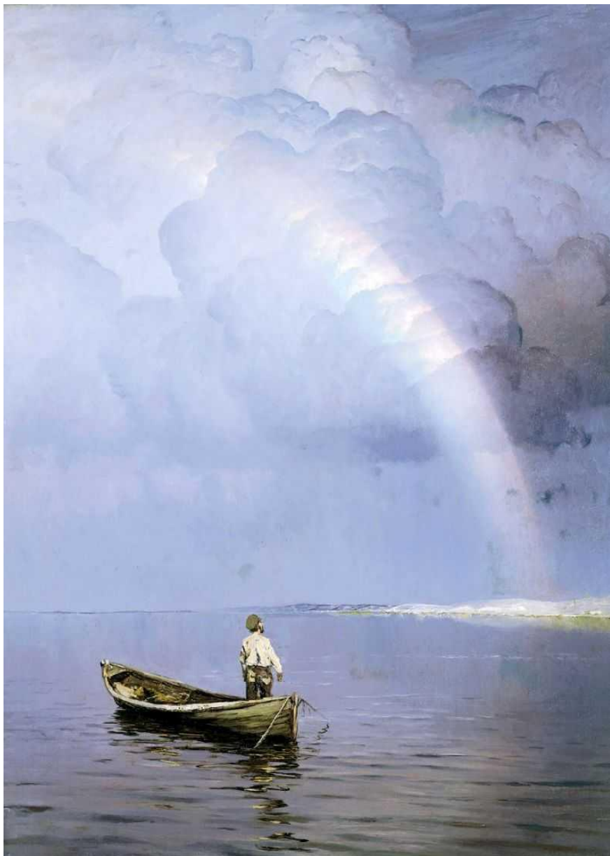
Н.Н. Дубовской «Радуга»