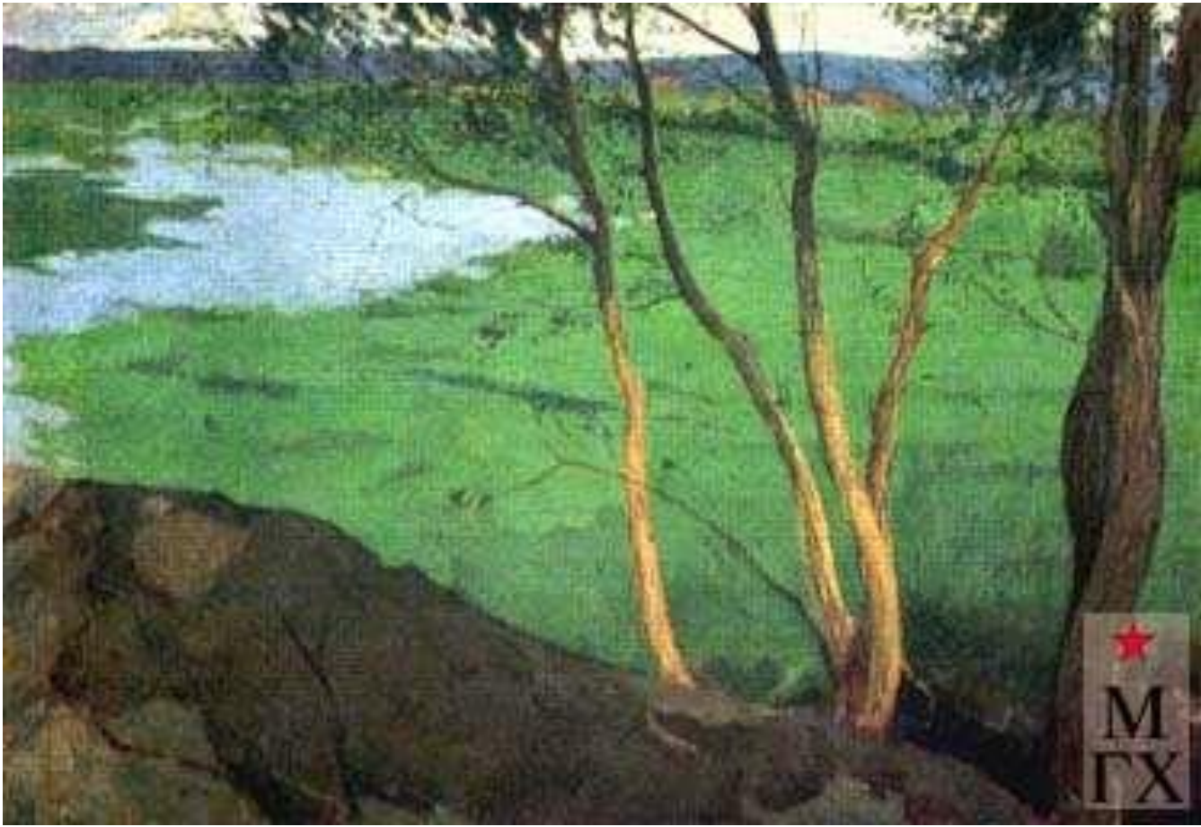
М.Б. Греков. Луга.