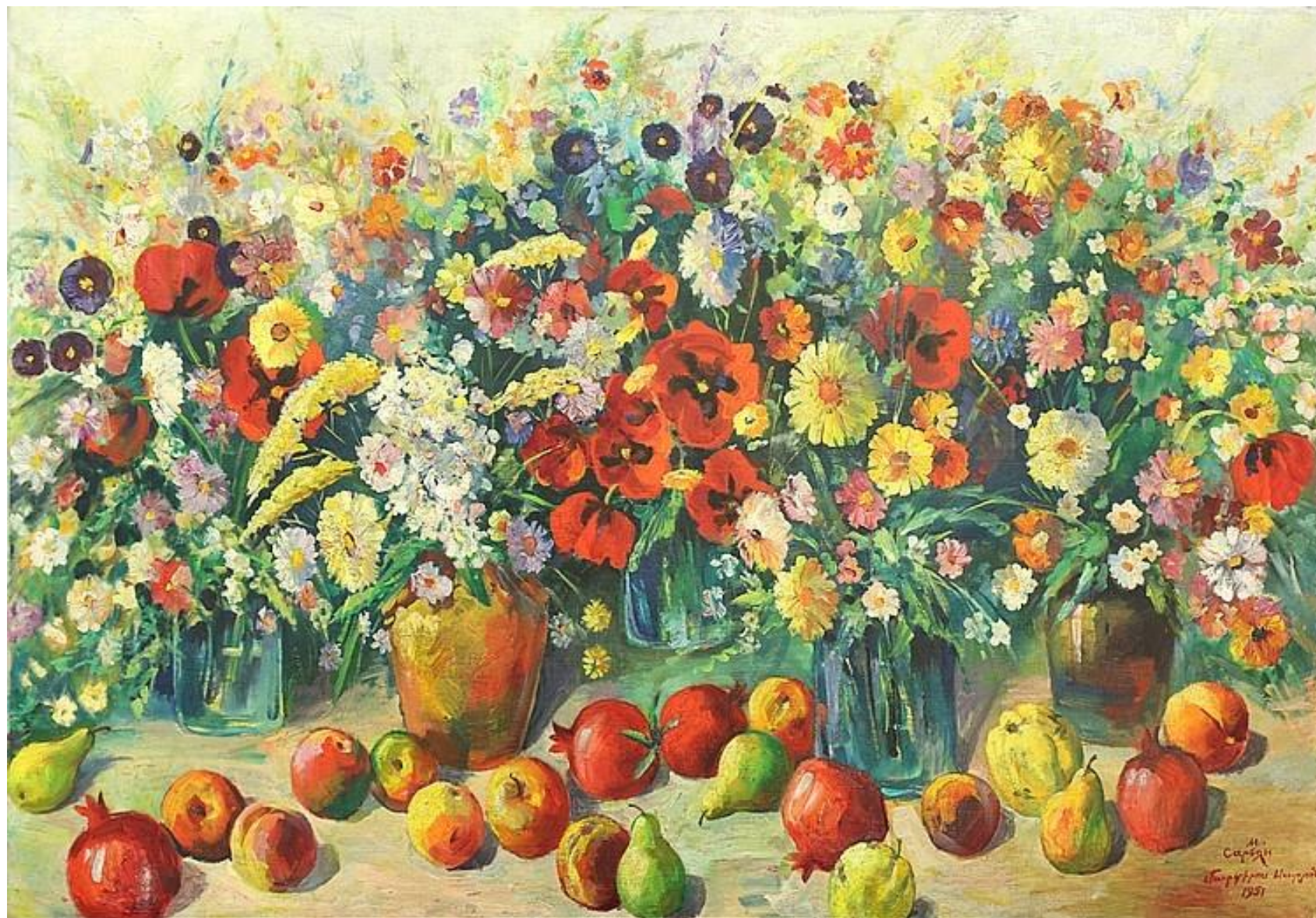
М.С. Сырьян. Цветы и фрукты