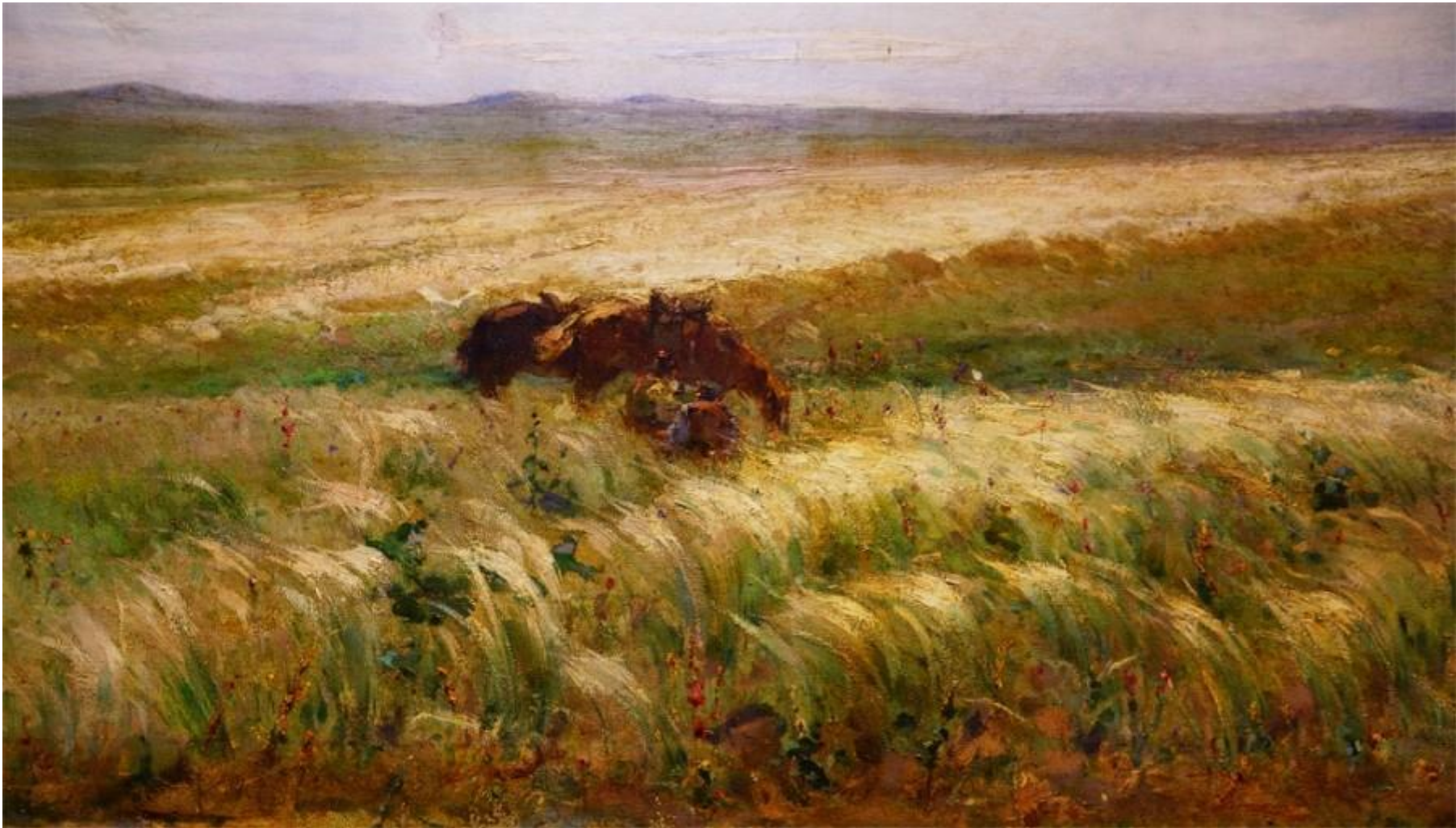
И. И. Крылов «Степь ковыльная»