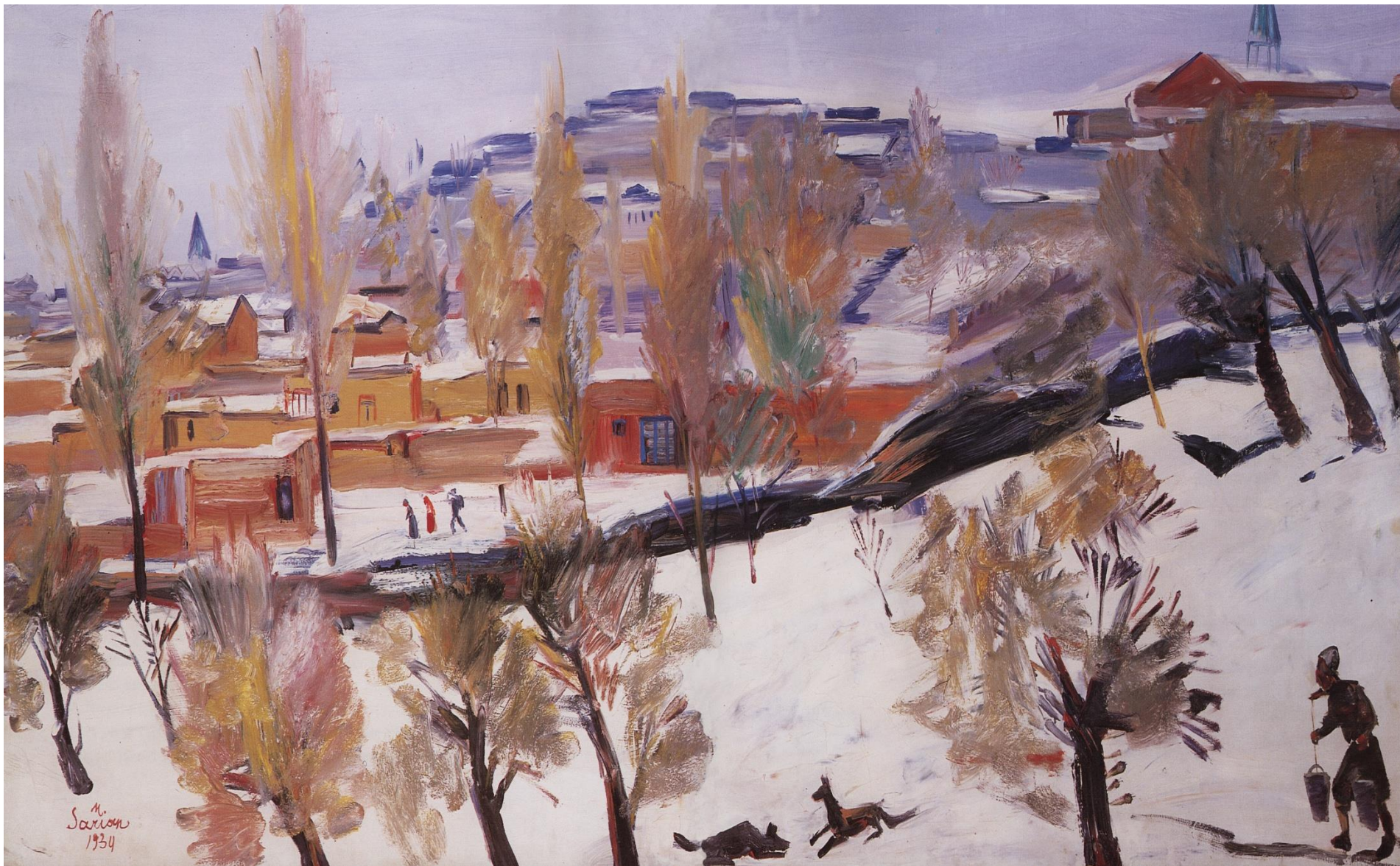
М.С. Сырьян. Южная зима.