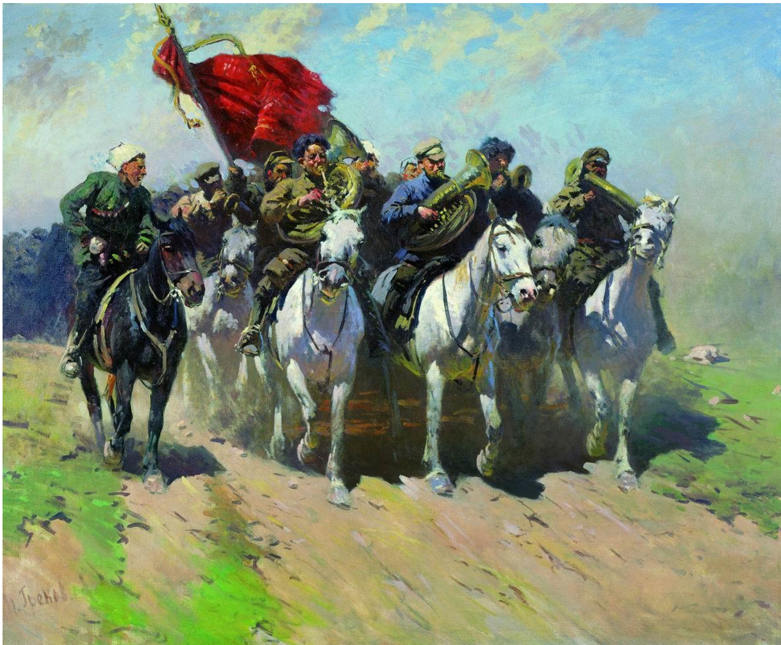
М.Б. Греков. Трубачи первой конной.