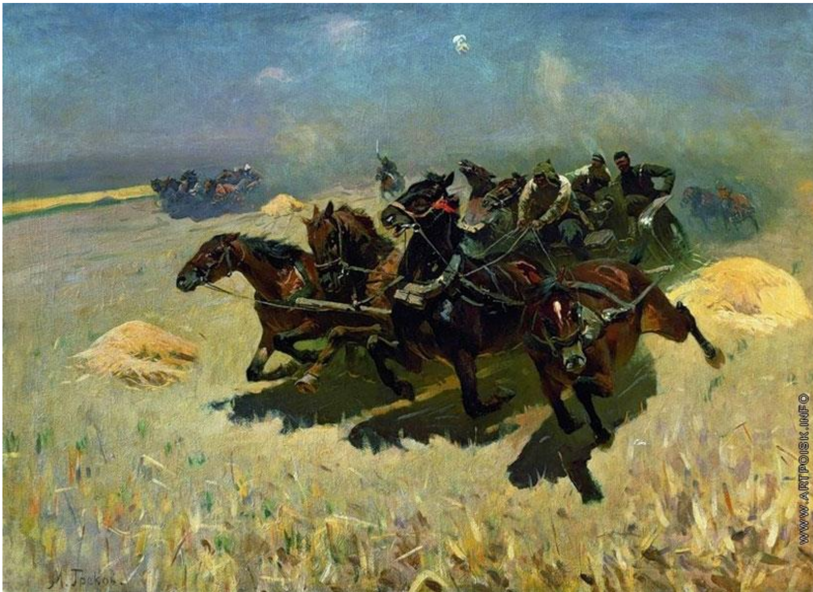
М.Б. Греков. Тачанка