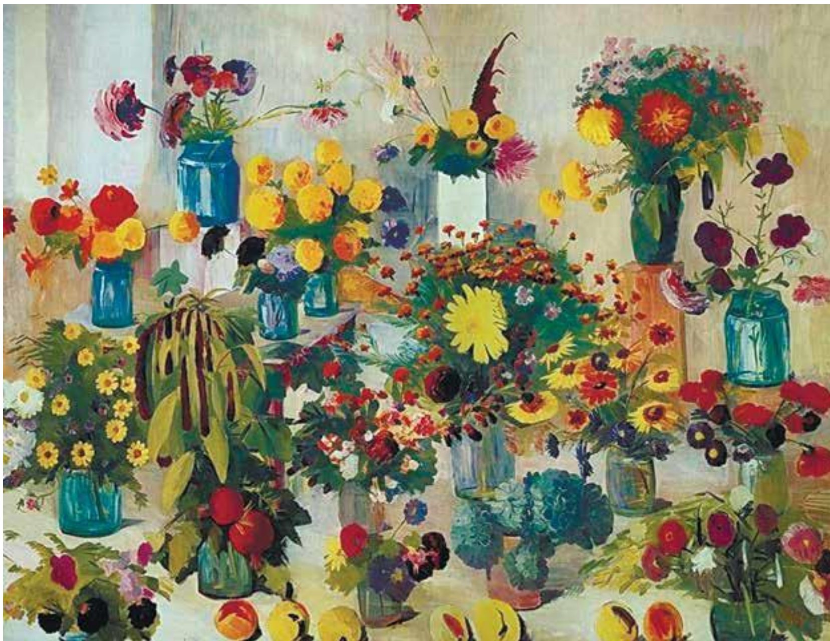
М.С. Сырьян «Майские цветы»