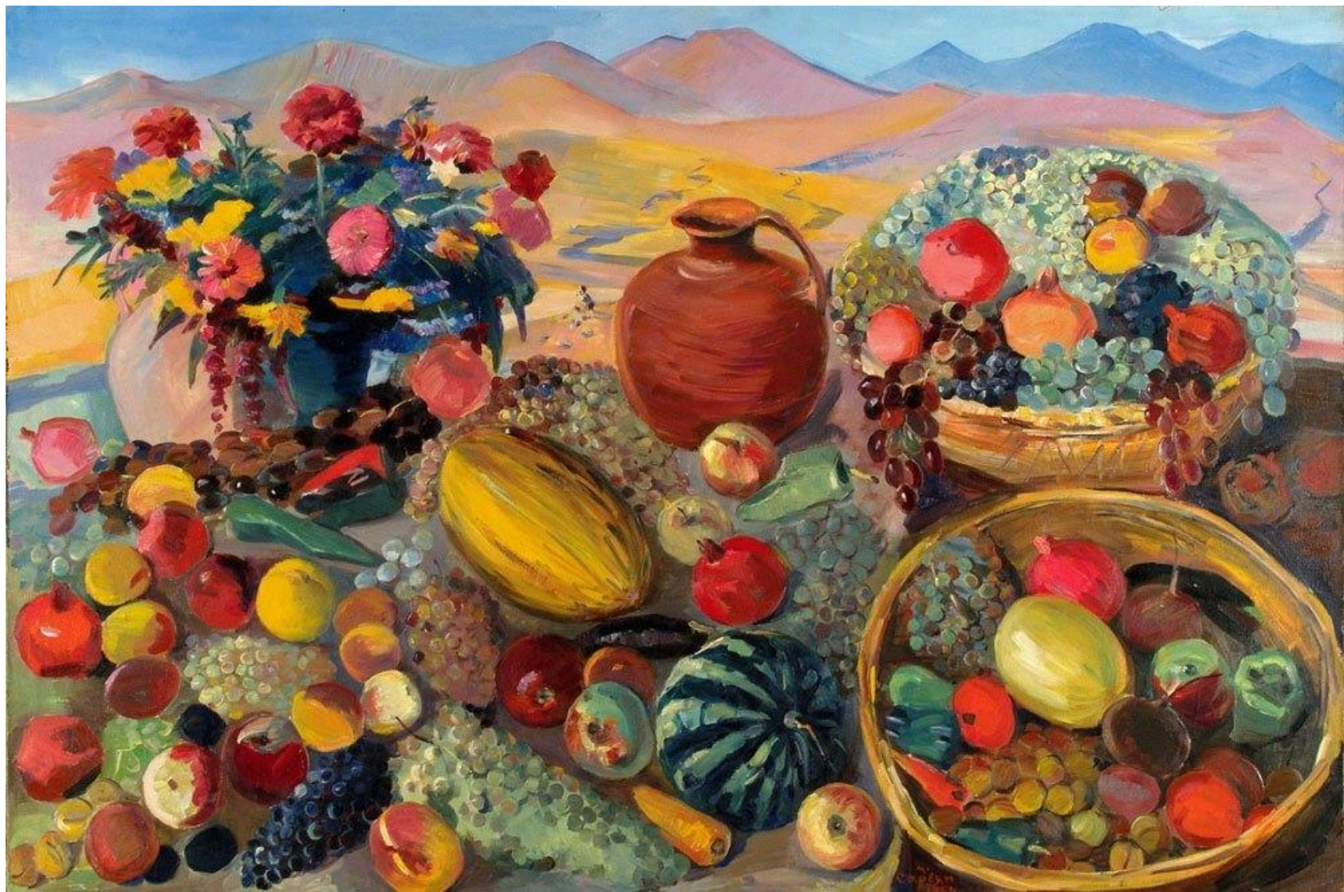
М.С. Сырьян. Фрукты