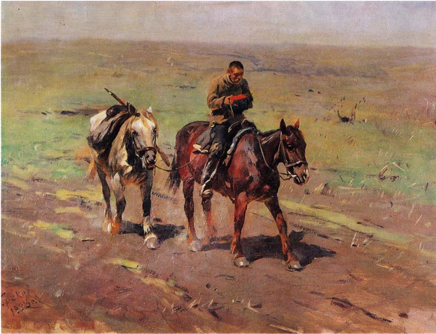
М.Б. Греков. В отряд к Буденному.