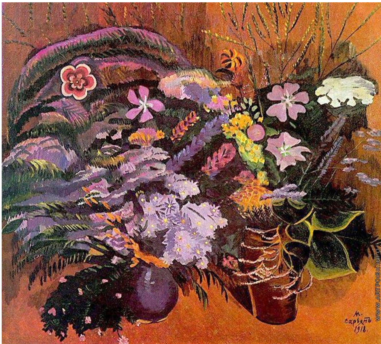
М.С. Сырян . Луговые цветы