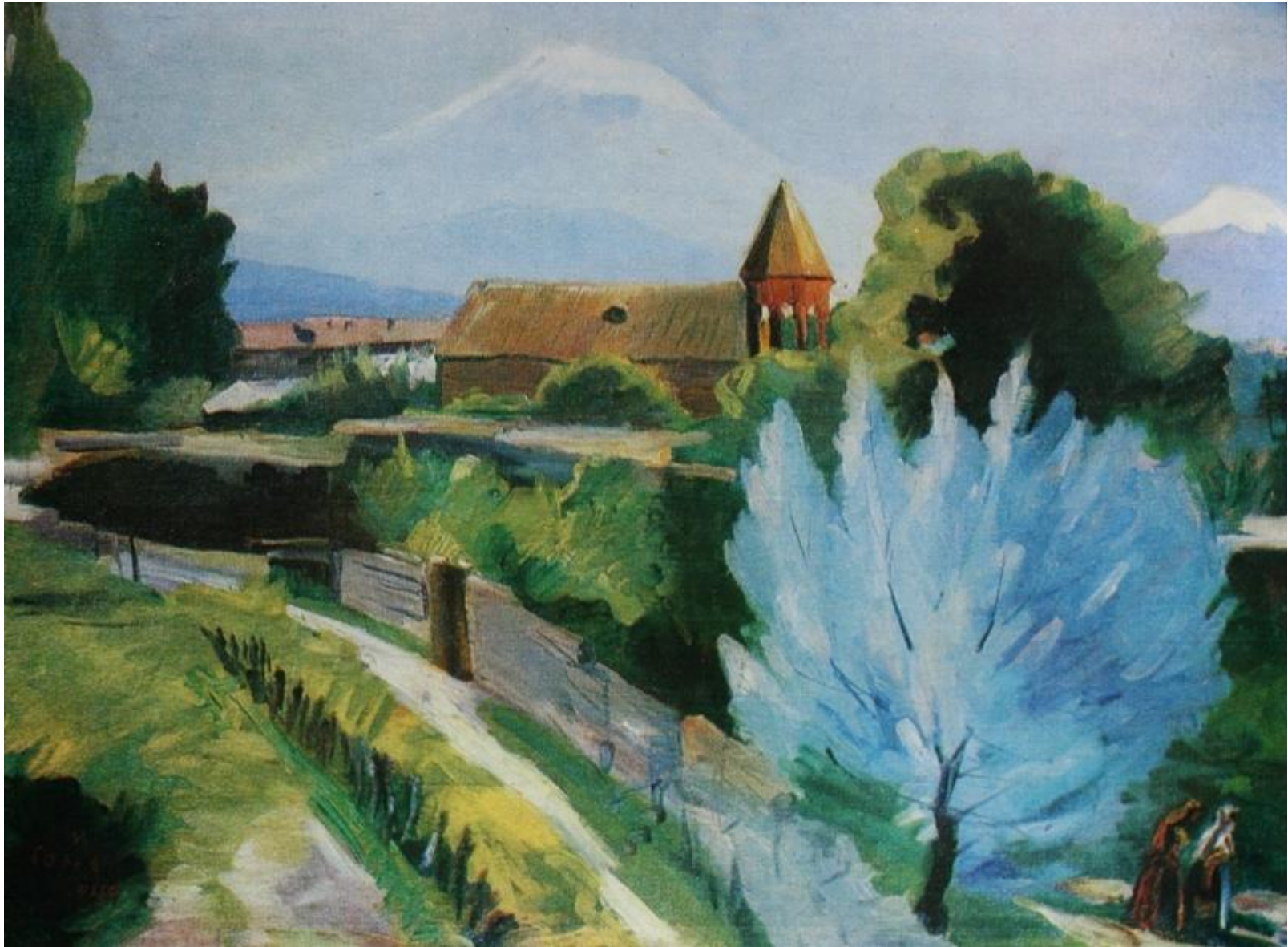
М.С. Сырьян. Апрельский пейзаж.