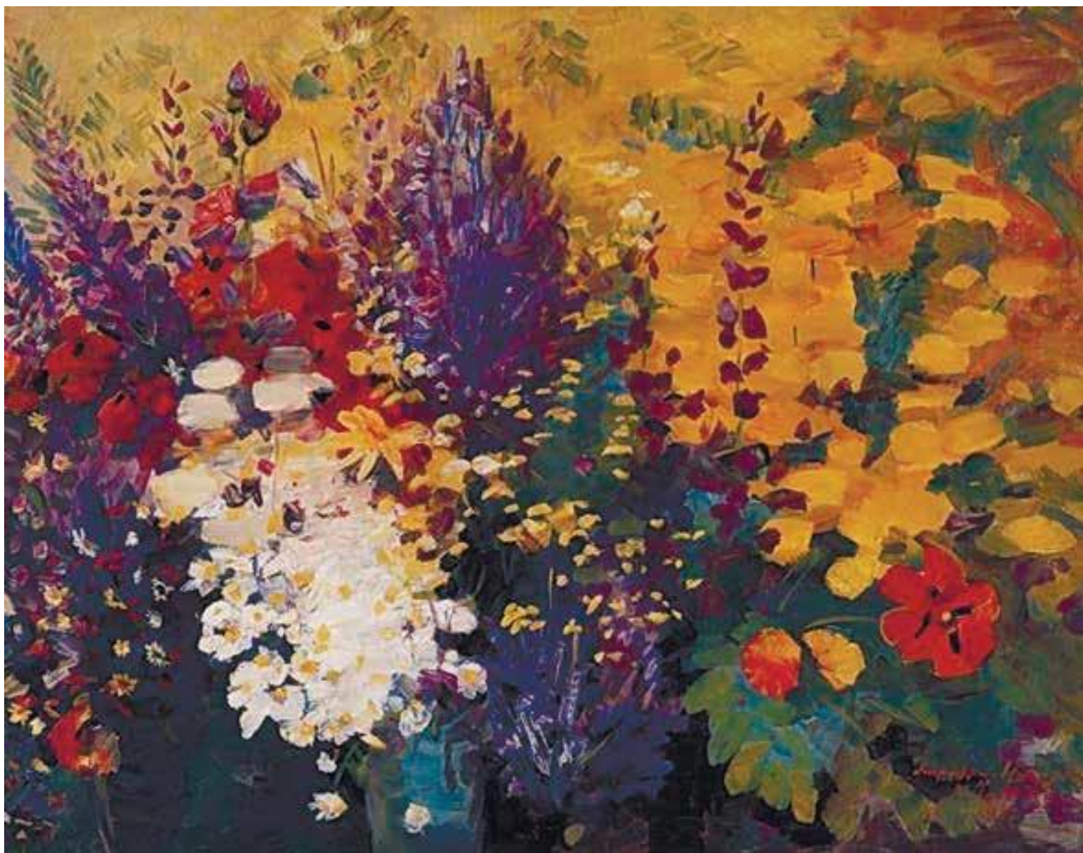
М.С. Сырьян «Цветы»