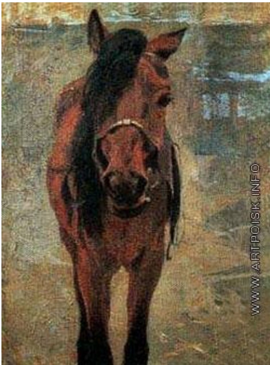
М.Б. Греков. Конь Русак.